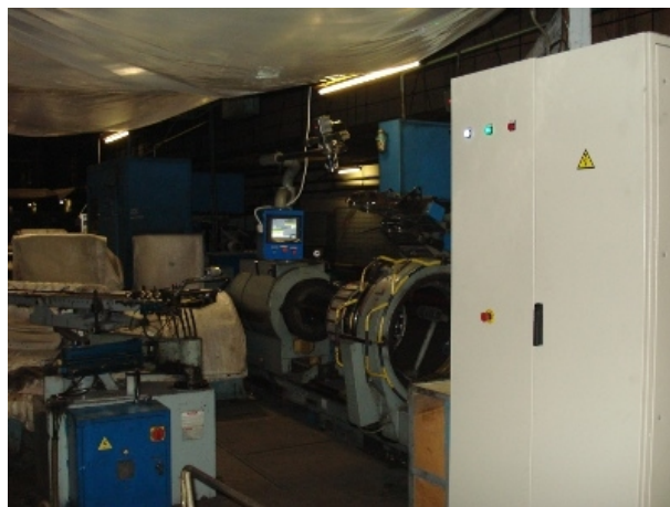
Общий вид станка до начала работы и после